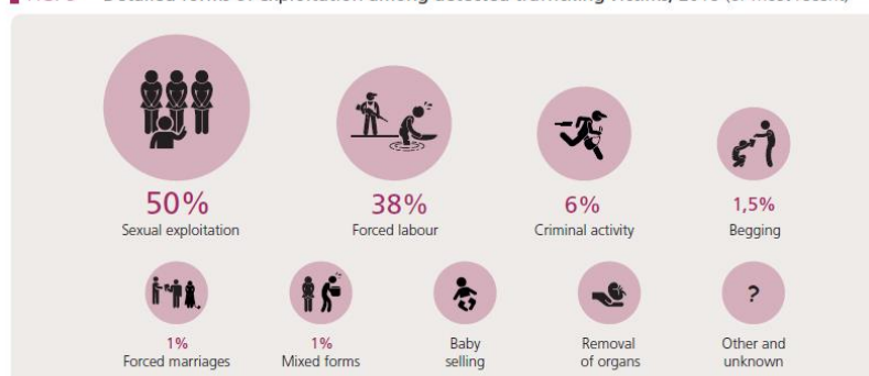
FIG. 9 Detailed forms of exploitation among detected trafficking victims, 2018 (or most recent)